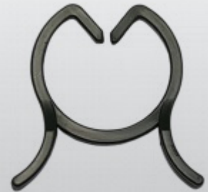
NP CLIPPRING 16, 20, 25 mm standaard