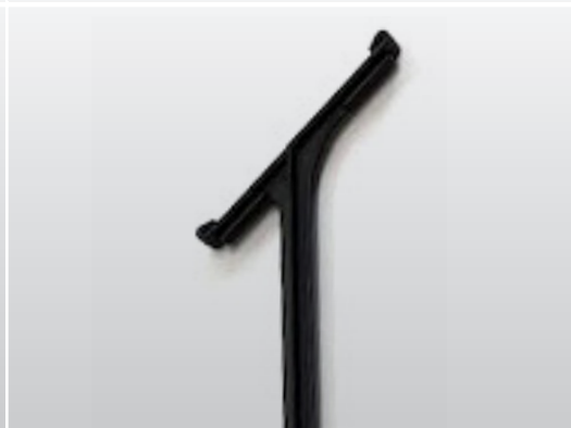
NP TRAY STOK ETIKET HORIZ.