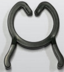
NP CLIPPRING 13, 32 mm standaard