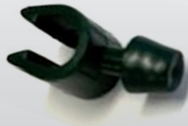
NP STOKCLIP MET ETIKET-NOK 6-7 mm standaard - ronde nok