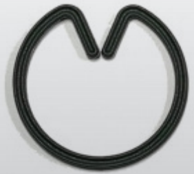
NP PLANTRING 16, 20, 25 mm standaard, 25 mm lightweight