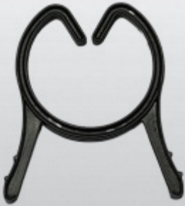
NP CLIPPRING 20 mm lightweight