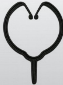
NP CLIPPRING 25 mm Push On, 25 mm lightweight Push On