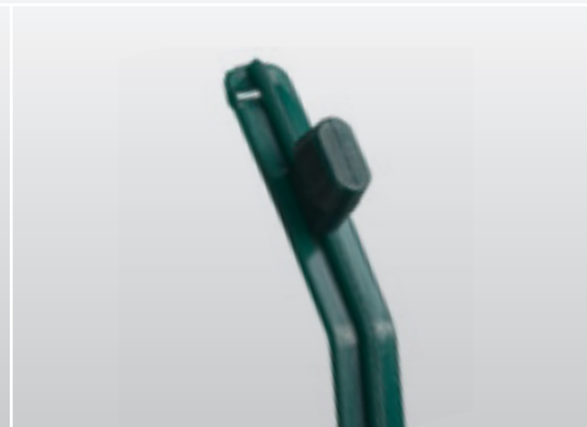
NP STEKER - ovale nok - 60°