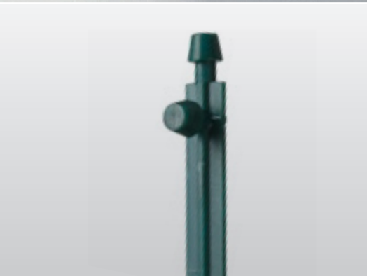
NP STEKER - ronde nok

Bio-based en/of bio-afbreekbaar zijn in ontwikkeling.