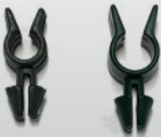
NP STOKCLIP MET ETIKET-NOK 4-6, 6-8 mm gespleten ronde nok