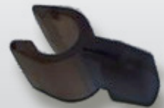
NP STOKCLIP MET ETIKET-NOK 6-7 mm standaard - ovale nok