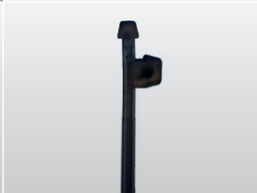
NP STEKER - ovale nok