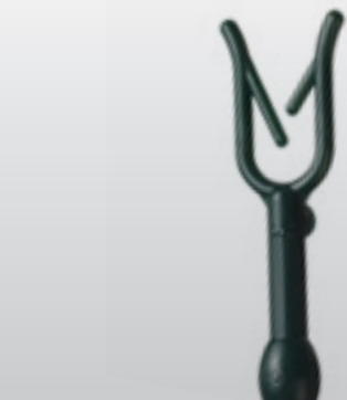
NP U STEKER